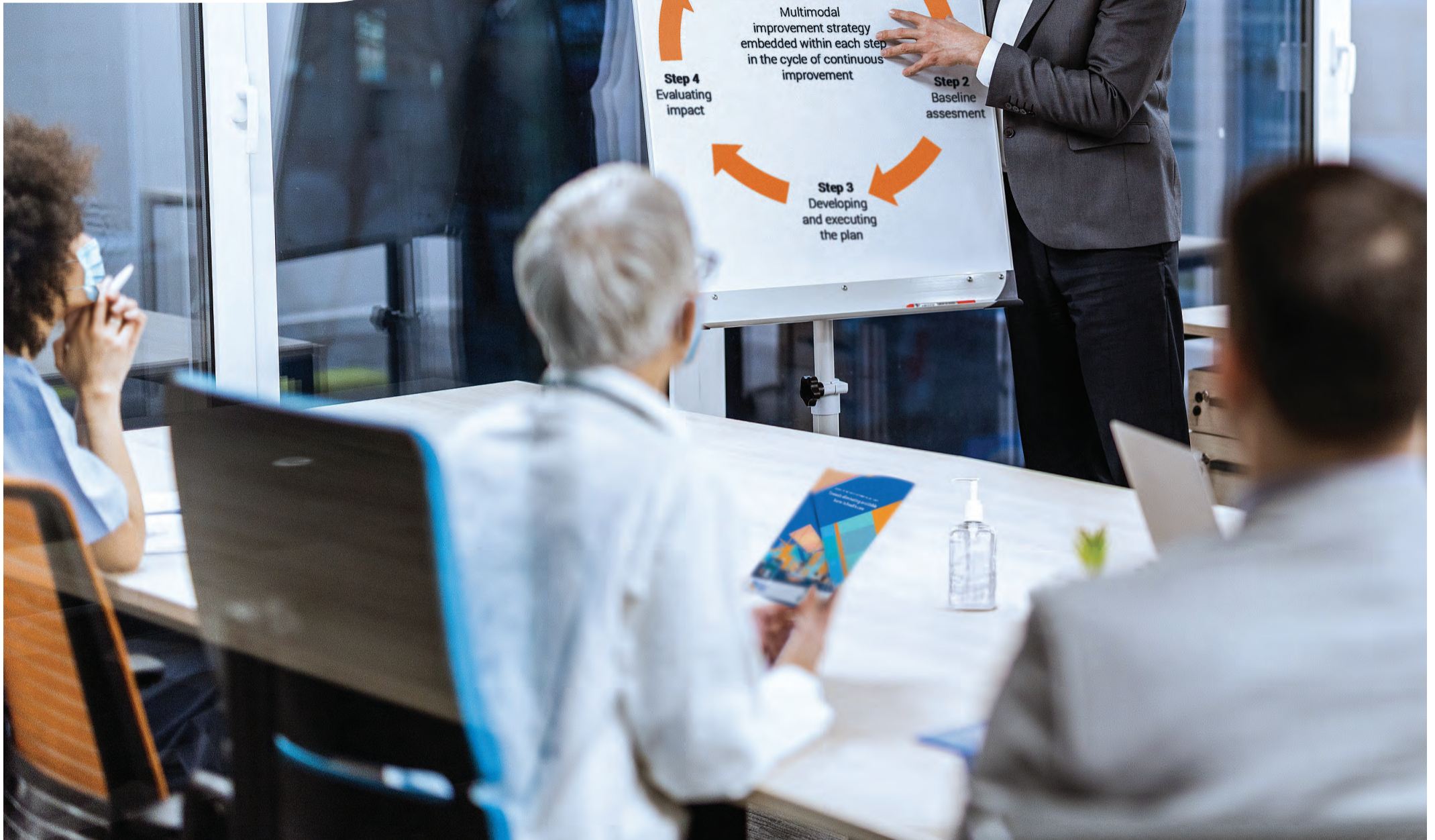
Figure 2. Steps of implementation